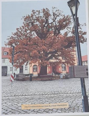
Die Friedensiche auf dem Kyritzer Marktplatz

Die Friedensiche auf dem Kyritzer Marktplatz ist ebenfalls ein beliebter Treffpunkt für die Bürgerinnen und Bürger. Sie ist ein Symbol für die Freiheit der Kirche.