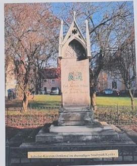
Schule-Kyritz-Denkmal im ehemaligen Stadtpark Kyritz