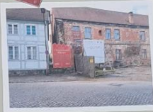
Klostergebäude des Franziskaner Klosters